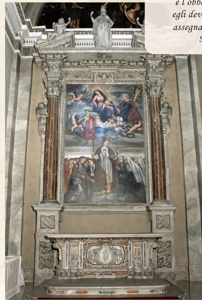
L'angelo adorante in marmo bianco del XV secolo, di bottega bresciana, si trova nell'altare di Sant'Orsola, sulla parete di fondo dell'omonima chiesa in via Cavalli.