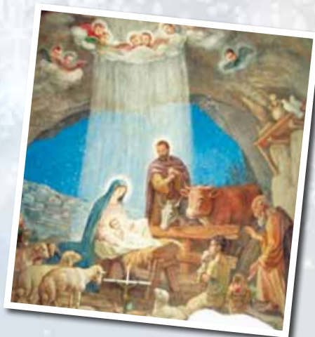
Natività - chiesa del campo dei pastori a Betlemme