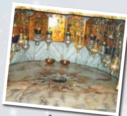
Stella che indica il luogo in cui è nato Gesù - basilica della Natività a Betlemme