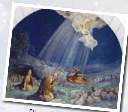
Gli angeli annunciano ai pastori la nascita di Gesù - chiesa del campo dei pastori a Betlemme